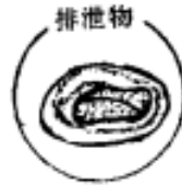
排 泄 物