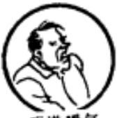
呃 逆 嗝 气